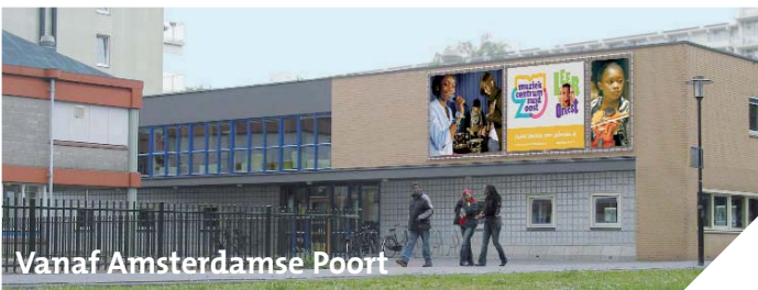
Vanaf Amsterdamse Poort

Neem vanuit de stationshal uitgang Amsterdamse Poort . Loop rechtdoor de poort onderdoor het winkelcentrum in. Na de eerste winkels is er een groot plein. Steek dit over en houd rechts aan tussen de winkels en het ING bankgebouw. Sla na ca. 100 meter rechtsaf (eerste weg rechts). Loop onder het viaduct door. Volg het fietspad rechtdoor onder een flatgebouw. Eenmaal aan de andere kant ziet u het MZO gebouw.